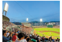
スポーツや観戦で